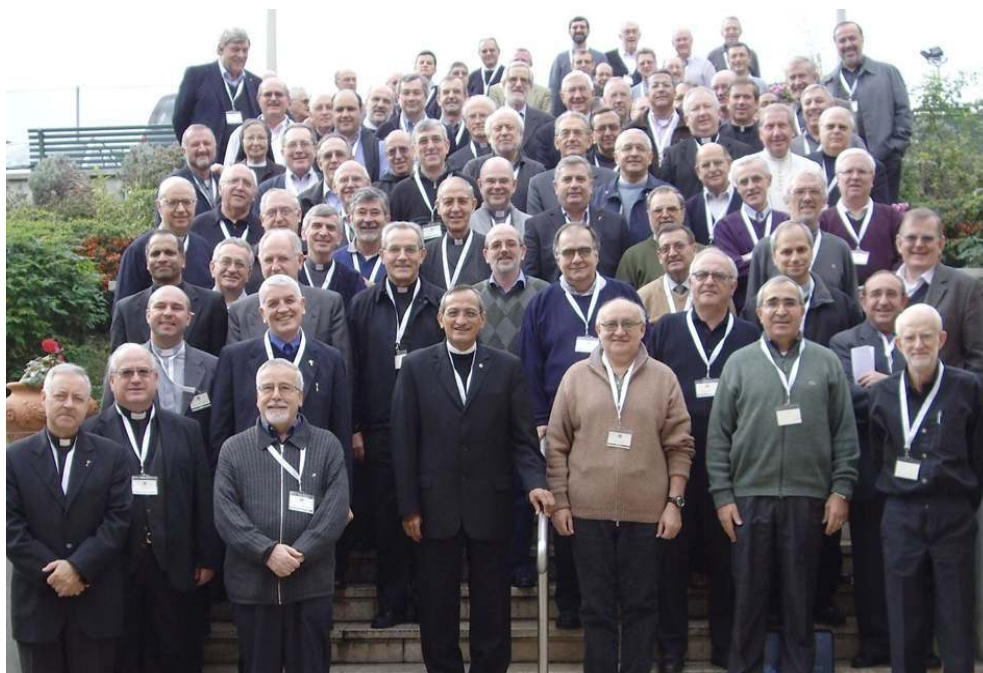
LA 74ª ASSEMBLEA SEMESTRALE DEI SUPERIORI GENERALI